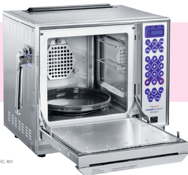
Merrychef EC 401