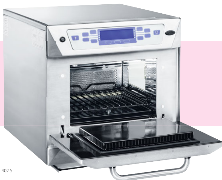
Merrychef 402 S