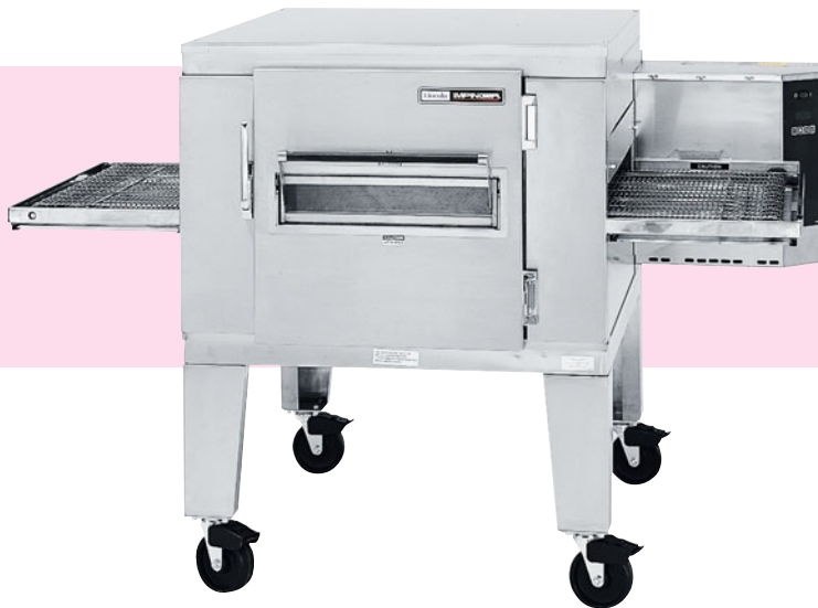
1421 EA mit Untergestell hoch (optional)