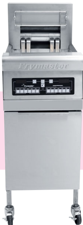
RE 14-2 mit Multifunktions-Computer „Magic III“