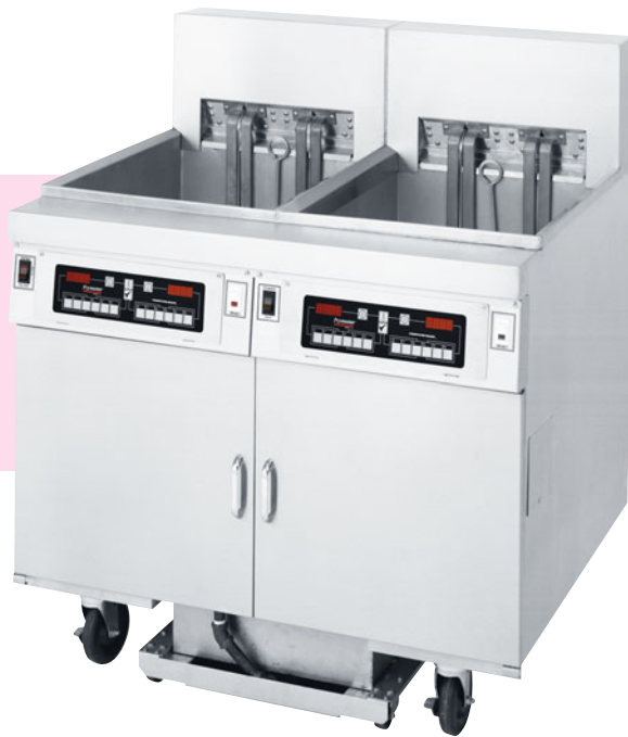
Abbildung enthält Sonderausstattung