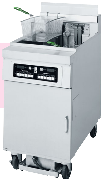
Abbildung enthält Sonderausstattung