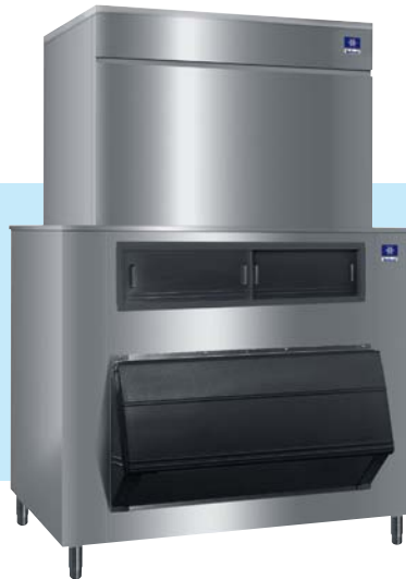
S 3300 mit Speicher F 1325 (optional)